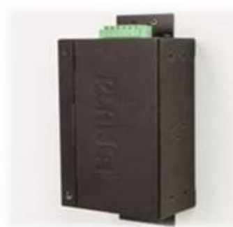
Wall mounting (Space saving)